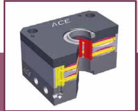
03 Geeignet für Stangen mit Durchmessern von 16 bis 40 mm, nehmen die Klemmelemente die Kräfte axial wie rotativ auf

serie sind in der Lage, 9 Nm/Hub und 28200 Nm/h aufzunehmen. Der zulässige Massenbereich liegt dabei zwischen 2,7 kg und 36,2 kg und gilt für einen Temperaturbereich von 0 bis 66 °C. Sollen die Maschinenelemente im Außenbereich eingesetzt werden, verfügt ACE zudem über Varianten, die sogar beständig gegenüber Seewasser oder anderen aggressiven Materialien sind. In beiden Fällen sind die Dämpfer dank einer Vielzahl an Zubehör und Anschlussteilen auch in bestehende Konstruk-