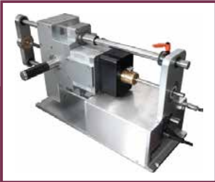
01 Die elektro-pneumatische Schneidemaschine durchtrennt die Abschirmungen von Hochvoltleitungen sauber, kraftschonend und sicher