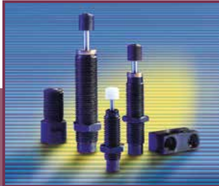
02 Ideal für kompakte Konstruktionen: Die Baureihe der Kleinstoßdämpfer verfügt über kurze Gesamtlängen und geringe Rückstellkräfte